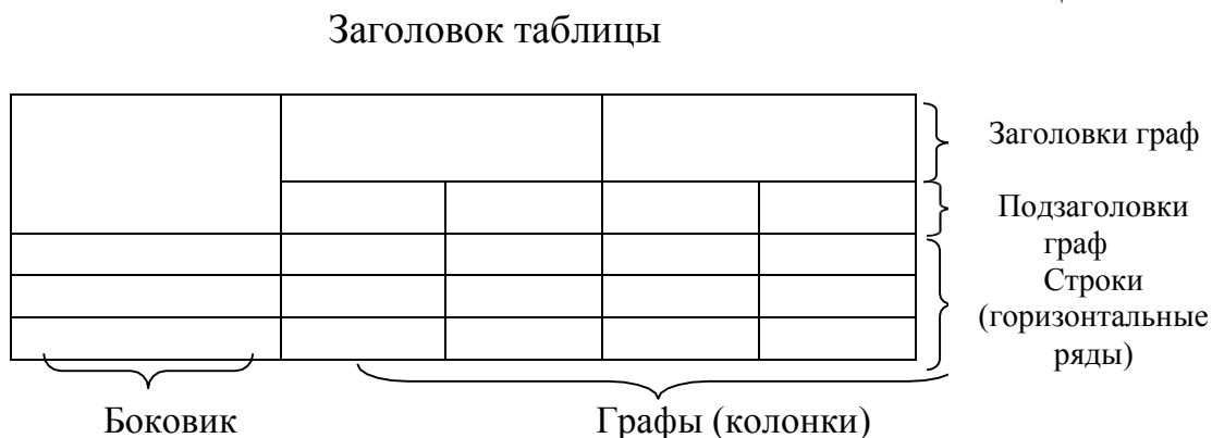
Рис. 1. Структура и вид таблицы

При переносе части таблицы на другую страницу слово «Таблица» и ее номер и заголовок указывают один раз над первой частью таблицы; над другими частями ставят слова «Продолжение табл.» и ее номер или «Окончание табл.» и ее номер.